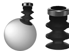
【适用于吸附面有倾斜或没有安装弹簧缓冲支架空间的场合】